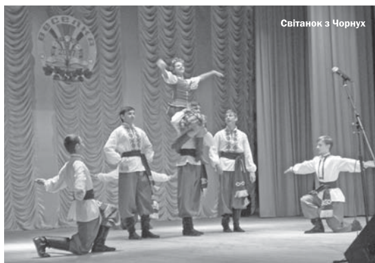
Світанок з Чорнух

Обласному огляду-конкурсу «Веселка» передують ще 2 етапи: районний/міський та зональний. У Полтаві кращих визначали в таких номінаціях: — вокал (естрадна, народна, авторська пісня, академічний); — хореографія (сучасна, народна, спортивно-бальна, класична);